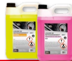
Liquide de refroidissement