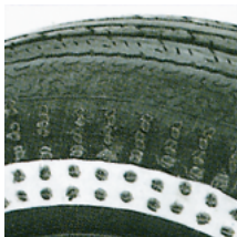
Schéma d'un pneu avec 950 chevilles PERMACURE. Le pneu a roulé 128.000 kms sans échec.